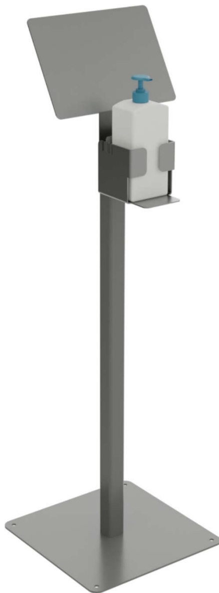
Dotykový desinfekční stojan INDUSTRIAL